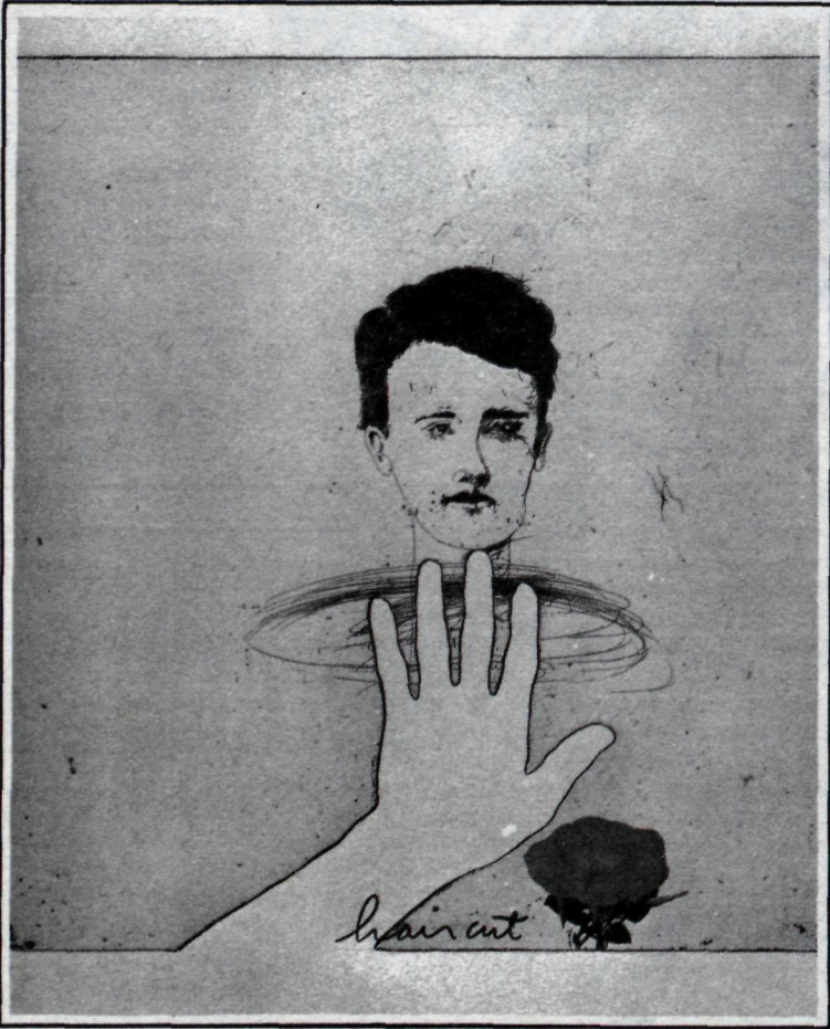
Jim Dine (1935): „Blue haircut“, 1972. Koparstunga og offset

Það eru einstakir hlutir, sem getur að líta í hálfum vestri sal Myndlistarhússins á Miklatúni þessa dimmu desemberdaga. Er hér um að ræða 70 myndir, sem gerðar eru í hinum ýmsu aðferðum listþrykksins eða grafik-listarinnar, sem okkur er tamara að nefna aðferðirnar. Hér er fyrirtækið Myndkynning enn á ferð og er þetta fjórða grafiksýningin er það stendur fyrir á þessum stað og sem allar hafa vakið mikla athygli. Á hinni fyrstu sýningu fyrirtækisins var Erró kynntur myndarlega á þessu sviði og vakti það framtak óskipta athygli, og átti vissulega sinn þátt í því að opna augu manna fyrir því hve þessi listamaður hafði verið af-ræktur meðal landa sinna. Um leið jók það áhuga manna fyrir því að kynna verkum þessa listamanns stórum nánar og hefur m.a. átt sinn þátt í hinni stóru yfirlitssýningu Erró að Kjarvalsstöðum á síðustu listahátíð. Sýningar Myndkynningar hafa einnig vakið upp deilur og er ekki nema gott um það að segja, því að umræður um þessa listgrein