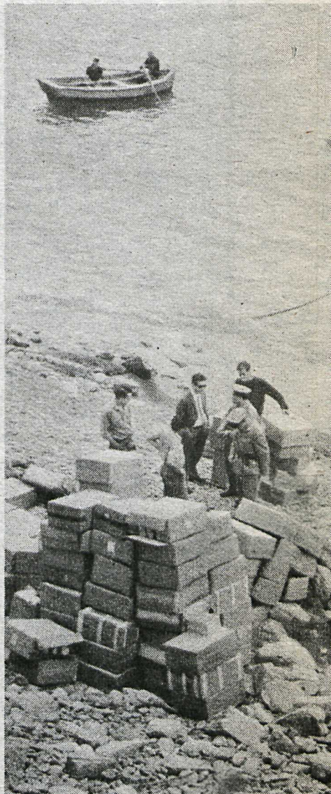
Arangur herferðar lögreglunnar. A ströndin sem gerðir hafa verið upptækir.

Þrem skrefum frá dyrum tóbaksbúðarinnar hefur „hin óhreina samkeppni“ komið sér fyrir. Við bráðabirgðaborð stendur holdug kona og selur sigarettur. Pakki með þekktu merki svo sem Dunhill eða Philip Morris kostar 500 lírur (u.þ.b. 250 kr). Fyrir þá upphæð er ekki einu sinni hægt að fá innlenda rudda í tóbaksbúðinni. Kaupmaðurinn í tóbaksbúðinni stendur langtímum saman í dyrunum, leikur jó-jó með báðum höndum og setur öðru hverju upptrekkar Mikka mýs