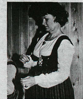
sitt á Kjarvalsstöðum á sunnudaginn og stendur það fram á mánudagskvöld.

Þá má geta þess, að Bandalag kvenna sem stendur fyrir þessari sýningu heldur þing