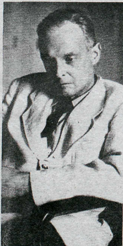
Paul Klee. Myndin er tekin í Berlín nokkrum árum fyrir dauða hans.

Grafíkmyndir þýskra expressionista sýndar á Kjarvalsstöðum 10.-18. maí