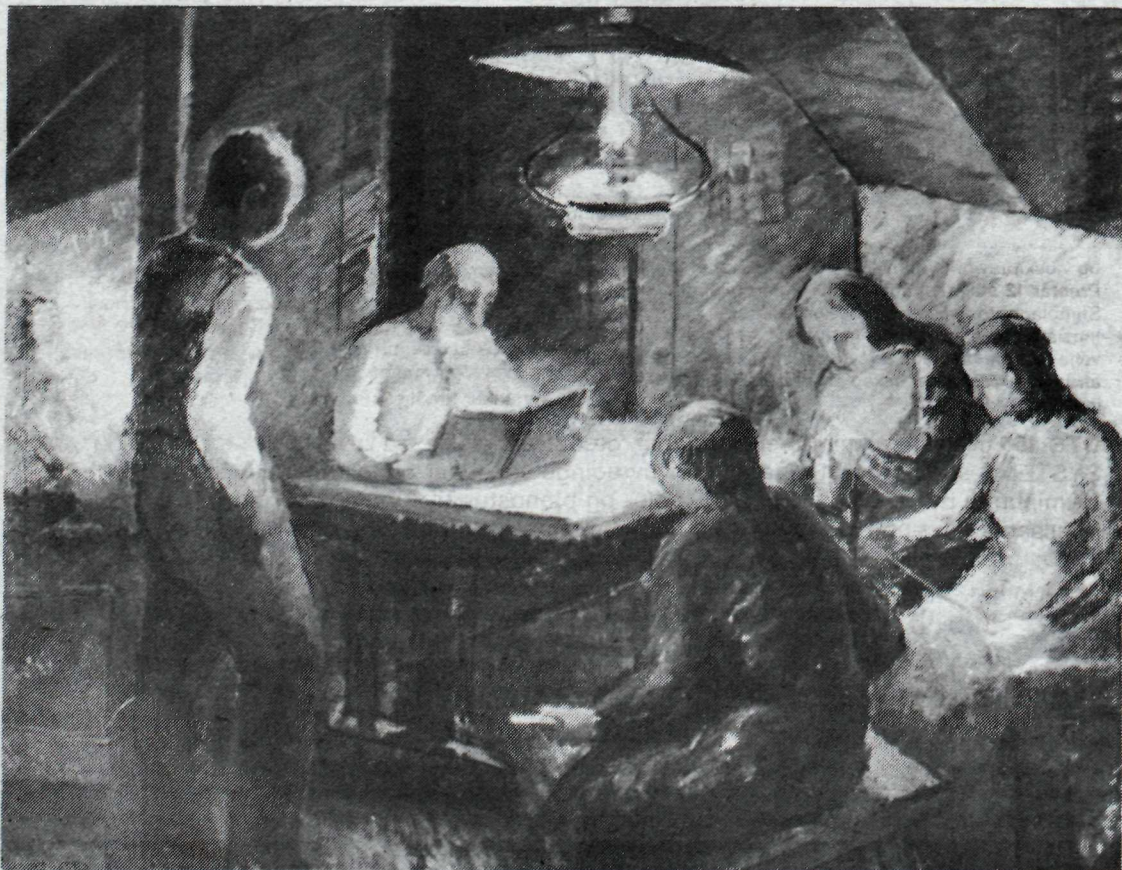
Kvöld í baðstofu.