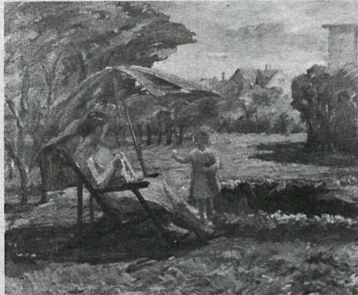
Í garði, 1952

listar? Hvers vegna verður hið langa hlé á sýningum hennar, frá 1936—1952 og hvers vegna sýnir hún ekkert eftir 1952? Þetta eru aðeins örfáar af þeim spurningum sem koma manni í hug við skoðun sýningarinnar.