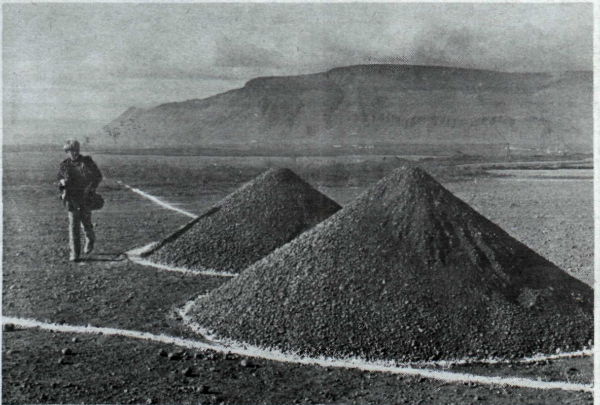
Umhverfisskúlpúr á umhverfislistasýningunni að Korpúlfsstöðum sem lýkur á sunnudag.

Ákveðið hefur verið að framlengja umhverfislistasýninguna, Experimental Environment 1980, sem staðið hefur yfir að Korpúlfsstöðum að undanfögnu. Að sögn aðstandenda sýningarinnar hefur aðsóknin verið góð, sérstaklega um helgar, og var því ákveðið að framlengja sýninguna til sunnudagskvölds en upphaflega átti henni að ljúka á síðastliðin fimmtudag.