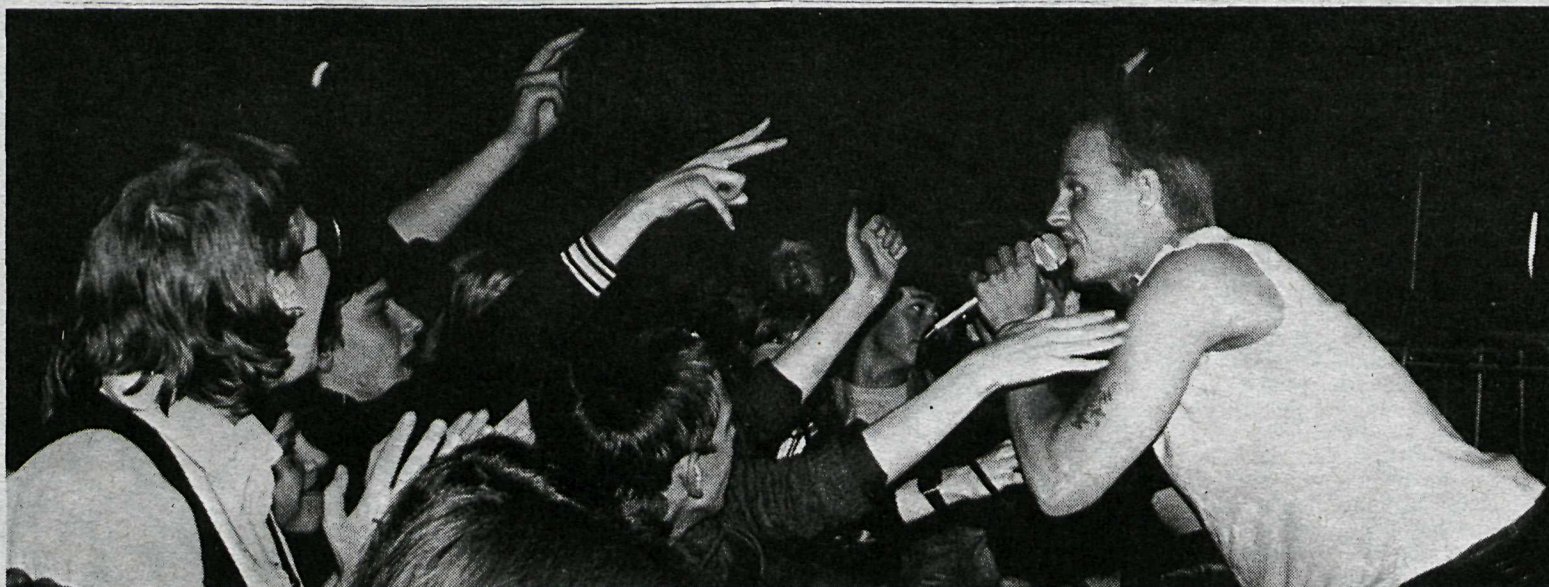
Selst eftir Bubba.

Þ. 6. sept., verður opnuð sýning Septem-hópsins, en ekki er enn víst, hve margir úr hópnunum sýna þetta sinn. Undir lok september verður svo Haustsýning Félags Íslenskra myndlistarmanna. Að þessu sinni hefur sex félagsmönnum verið boðið að sýna og mun ætlunin að gera hverjum þeirra myndarleg skil og er það fráhrarfrá því sniði að sýna fáar myndir eftir marga listamenn.