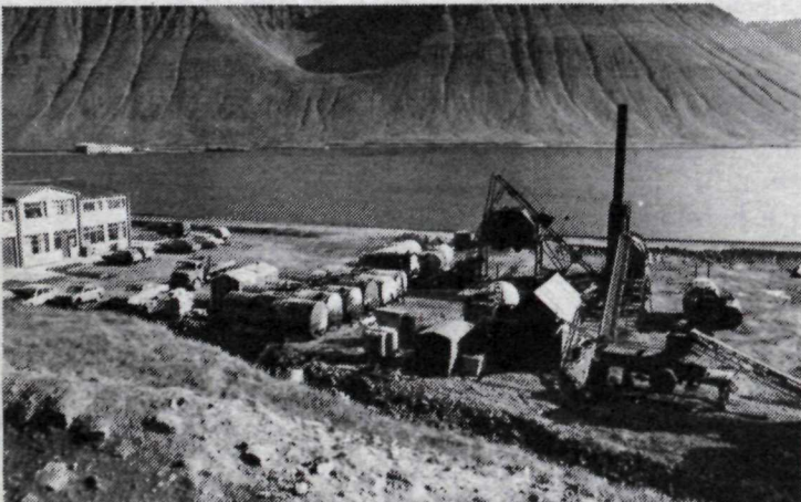
Malbikunarstöðin við Skutulsfjörð og fyrir neðan hana má sjá nýja veginn sem liggur inn fjörðinn og til vinstri á myndinni er húsnæði Orkubús Vestfjarða.

Miklar malbikunarframkvæmdir standa nú yfir á Ísafirði og er stærsta verkið malbikun vegarins milli Ísafjarðar og Hnífsdals og vegarins inn í fjörð, frá Eyrinni inn að Holtahverfinu. Fimm ár eru nú liðin frá því síðast var unnið að malbikunarframkvæmdum á Ísafirði og nú þegar þessar framkvæmdir standa yfir, er tækifærið notað og malbikað á Ísafjarðarflugvelli, bæði flugvélastæði og bílastæðin við flugvallarbygginguna. Þá verður einnig malbikað nokkuð á Bolungarvík og í Súðavík. Standa þessar framkvæmdir yfir fram á haustið eins og veður leyfa og halda síðan áfram næsta vor.