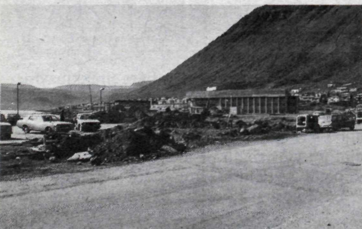
Vegaframkvæmdir við Hafnarstræti skammt neðan nýju sjúkrahússbyggingarinnar, þar sem Hnífsdalsvegurinn fer gegnum Ísafjörð og heldur áfram inn fjörðinn.