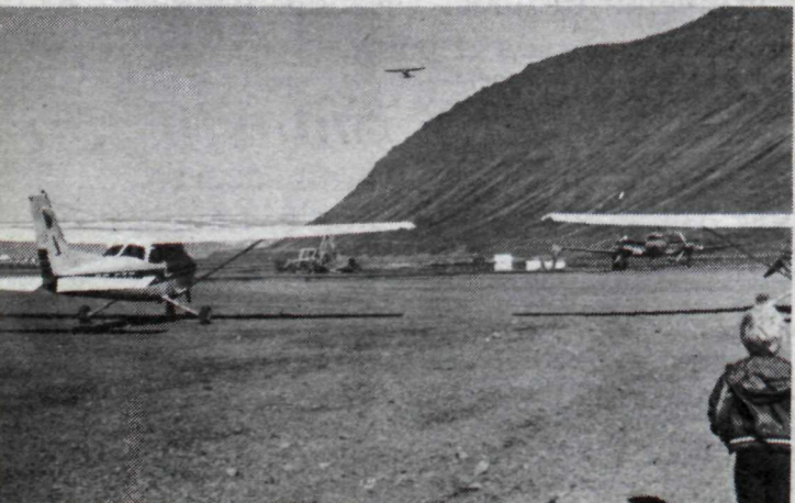
Á flugvellingnum á að malbika bæði bílastæði og flugvélastæði.