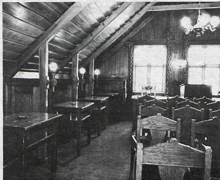
Badstofa og fundarherbergi Iðnaðarmannafélagsins í gömlu Iðná. Það hús er nú í eigu Reykjavíkurborgar, en badstofunni halda félagsmenn. Það hefur ekki væst um fundargesti í þessari stofu, sem er haglega gerð af Rikharði Jónssyni. Smíði badstofunnar var lokið árið 1926.