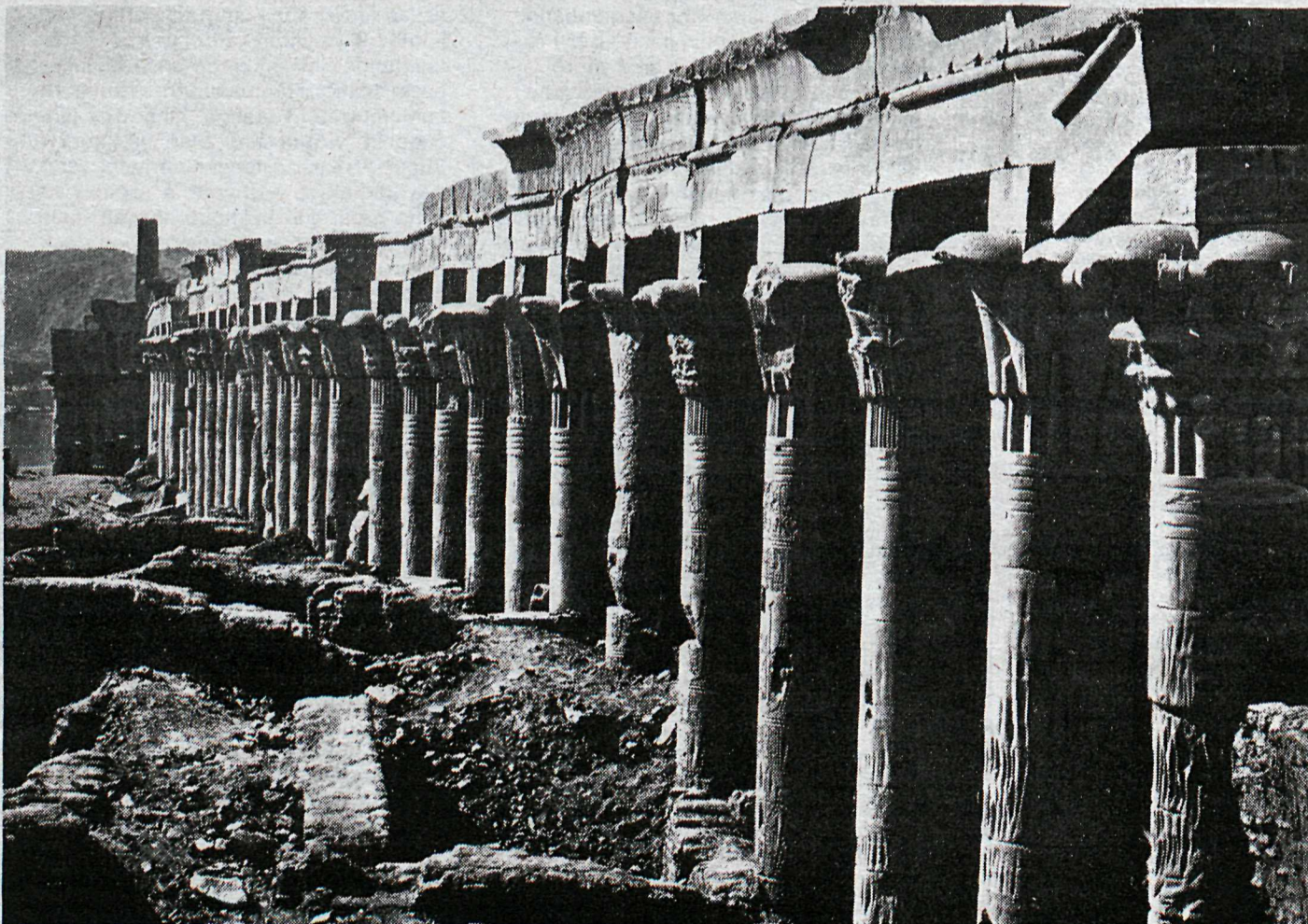
Eitt af yngri hofum Egypta, byggt um 100 f.Kr. á eyju í Níl.