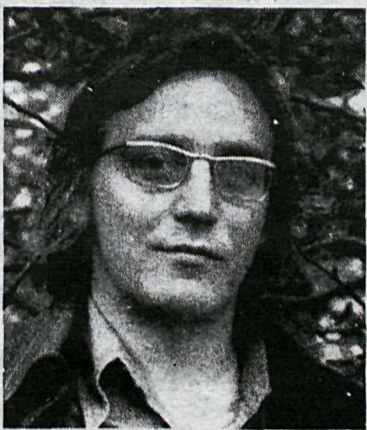
Finnski pianóleikarinn Ralf Gothoni.

Hinn þekkti finnski pianóleikari Ralf Gothoni heldur tónleika í Norræna húsinu n.k. þriðjudagskvöld kl. 20.30. Leikur hann þar m.a. sönötu eftir landa sinn Einojuhani Rautavaara, „Myndir á sýningu“ eftir Músorgski og svítu eftir Leos Janacek.