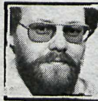
Umsjón: Elias Snæland Jónsson.

Monty Python-mynd. 58 þúsund áhorfendur.