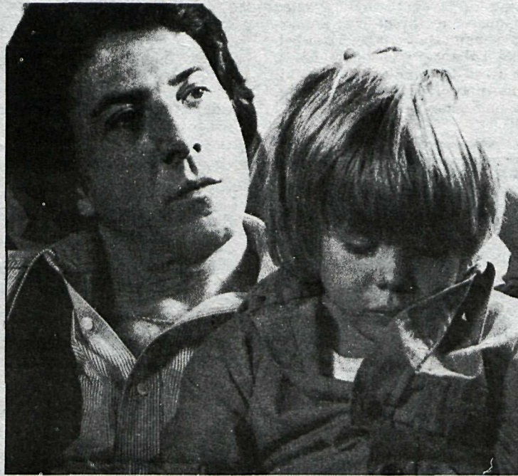
Faðir og sonur: Ted Kramer (Dustin Hoffman) og Billy sonur hans (Justin Henry) í „Kramer gegn Kramer“.