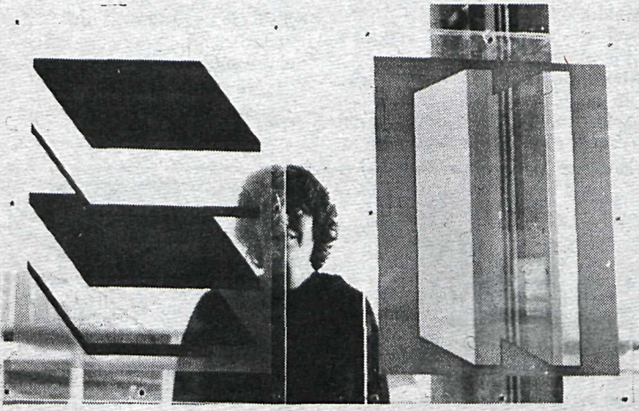
Grafík frá landi Mondriaans nefnist hollenska graffksýningin.

Grafíksýningin sýnir 31 verk eftir 10 listamenn. Þau eru unnin meðal annars í silkiprent og