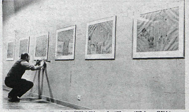
Frá sýningu Carls Fredriks Hill á Kjarvalsstöðum.

fara á Listaakademiuna í Stokkhólmi. Þar gerði hann þó stuttan stans, því tveimur árum síðar hélt hann til Parísar. Þar varð hann fyrir miklum áhrifum frá impressionisma og var á hraðri uppleið með að vinna sér frægð og frama. 1875 bauðst honum að sýna eitt verka sinna á Haustsýningunni í París. Hélt Hill