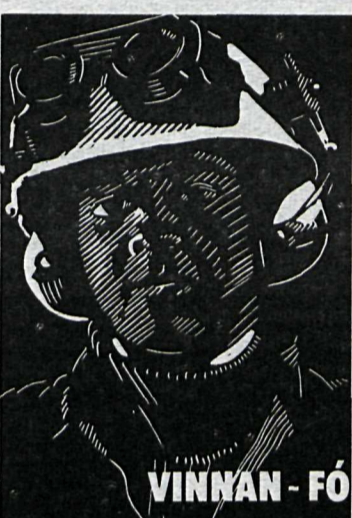
Flestar myndanna sýna verkamenn í járníðnaði eins og sú til vinstri (eftir Guðmund Ármann) eða í fiskiðnaði eins og sú til hægri (eftir Sigurð Þóri).

borgir hafa myndast og iðnvæðing er í mótn.“ Þeir eru báðir Reykvikingar,