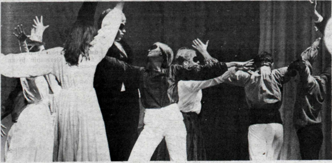
Úr gamanleiknum Ys og þys út af engu, sem Herranótt sýnir um þessar mundir í Félagsheimili Seltjarnarness.

Sýningar verða eins og áður í Félagsheimilinu á Seltjarnarnesi og hefjast kl. 20.30. Uppselt er á sýninguna á morgun en næstu sýningar þar á eftir eru á mánudag, þriðjudag og fimmtudag. Miðasala er á staðnum milli kl. 17 og 19 sýningardagana.