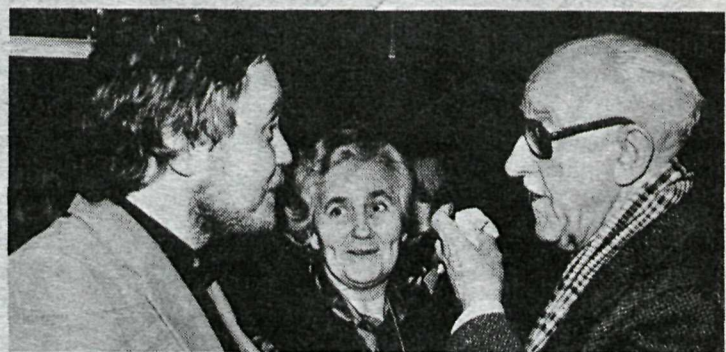
„Hinir stóru“ í íslenskri menningu.

neskjulegt líf, segir hann. — Líf á bændabýlum, sem eru of litil til að geta nokkurn tíma gefið af sér arð eða geta nýtt nýtskulegar vélar. Bændurnir steypa sér í ævilangar skuldir og sjá aldrei peninga. Og á sama tíma er geysileg umframframleiðsla og við töpum milljörðum króna á því t.d. að selja lambakjöt í fóður handa enskum hundum