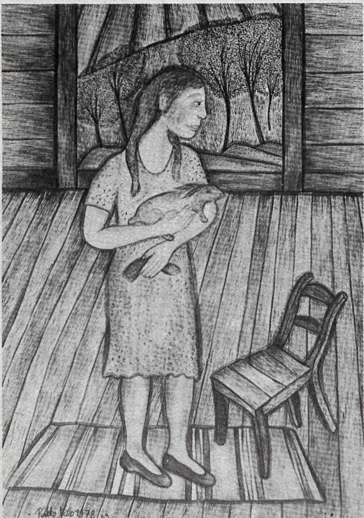
Þessi mynd heitir Eini vinurinn og er eftir Pirkko Valo frá Finnlandi. Pirkko er fædd 1943, hefur verið afkastamikil og haldið margar sýningar.