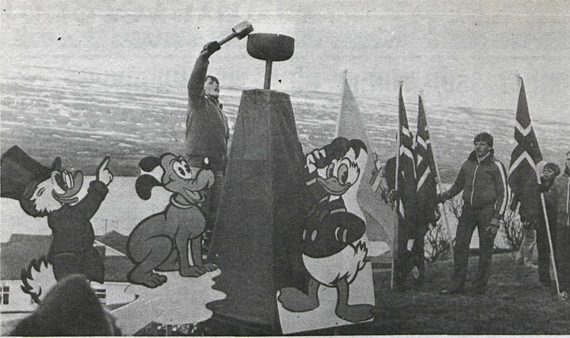
Andrésar-Andar leikarnir fara nú fram í Hlíðarfjalli og tekur mikill fjöldi barna viðs vegar að af landinu þátt í þeim. Þessi mynd var tekin við setningarathöfnina.