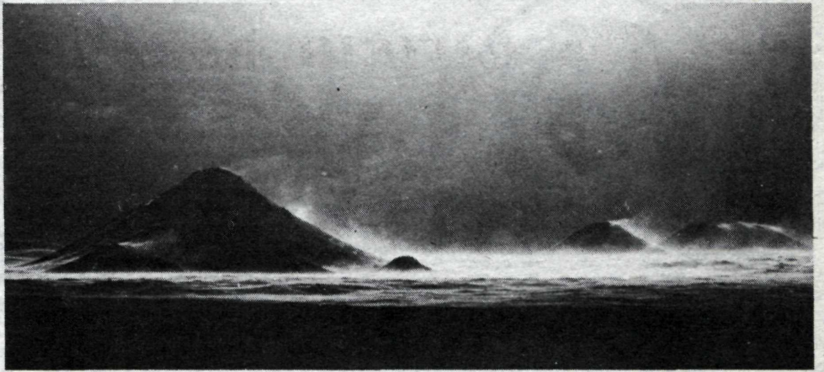
Keilir, ein ljósmynda Björns Rúrikssonar á sýningunni.

Hljómléikarnir eru haldnir af Utangarðsmönnum og Steríó.