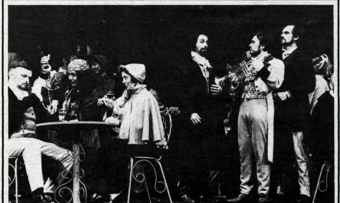
Úr óperunni La Bohème.