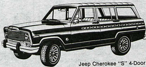
Jeep Cherokee "S" 4-Door