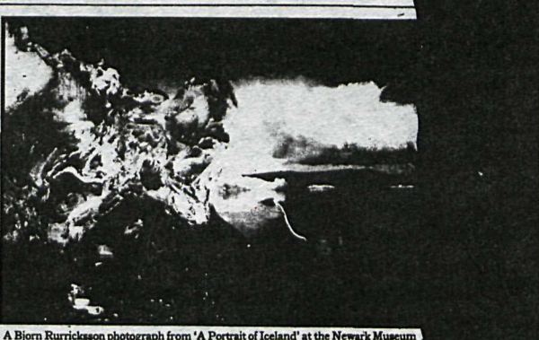
A Björn Rúriksson photograph from 'A Portrait of Iceland' at the Newark Museum

One has the disconcerting title, "Chaos of Ice in One of the Great Lakes Along the Margin of Vatnaálfjall, the Largest Icecap Outside the Polar Regions." In the foreground is an amazingly complicated form that is