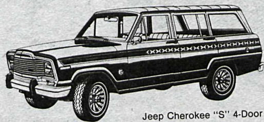
Jeep Cherokee "S" 4-Door