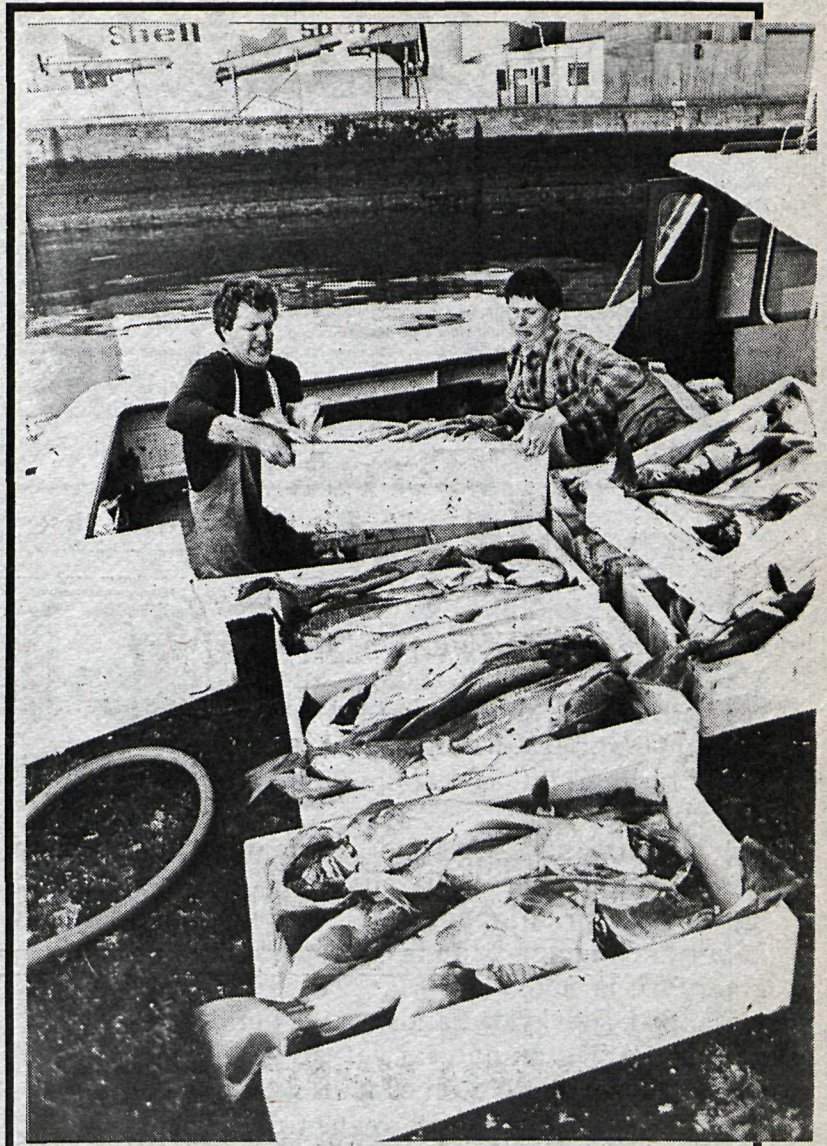
Trillukarlar ekki síður en aðrir hafa fiskað vel við Eyjar að undanfögnu — eins og t.d. þessir tveir, sem hér roga fiskkössunum í land.