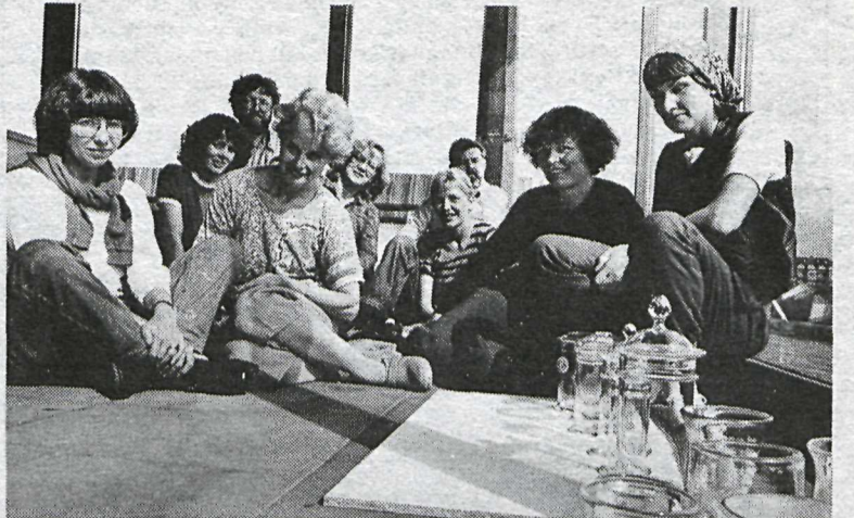
Níu af listamönnum þrettán sem halda sýningu í boði Kjarvalstaða.