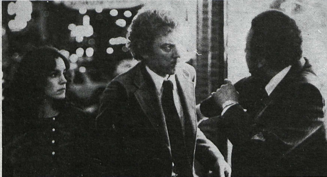
Elizabeth (Brooke Adams) og Matthew (Donald Sutherland) reyna að flýja undan geimverunum sem ráðast á San Francisco.

Tónabíó: Innrás líkamspjófanna Leikstjóri: Philip Kaufman Stjórnandi kvikmyndatöku: Michael Chapman Aðalleikarar: Donald Sutherland, Brooke Adams, Veronica Cartwright og Jeff Goldblum Bandarísk, árgerð 1979.