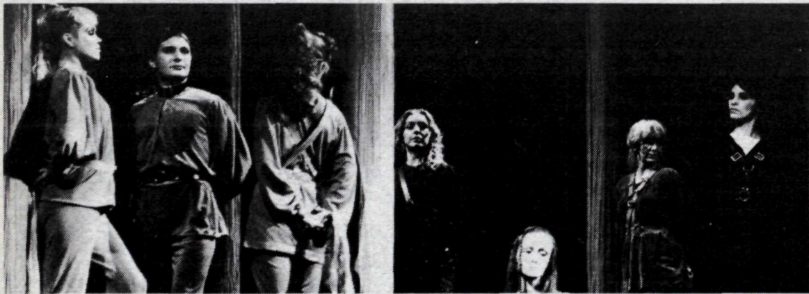
Söngleikurinn Gustur hefur fengið mjög góða dóma gagnrýnenda blaðanna

Sýningin er opin virka daga frá kl. 12–18 og 14–18 um helgar, en henni lýkur 29. þ.m.