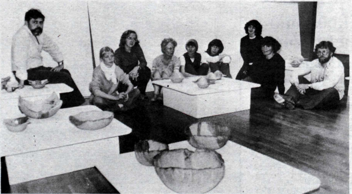
Alls munu 13 listamenn sýna verk sín á sýningunni í vestursal Kjarvalsstaða.

Um 6–7.000 gestir munu sækja lúðrasveitahátíðina í Hamar og 140 lúðrasveitir taka þátt í keppninni.