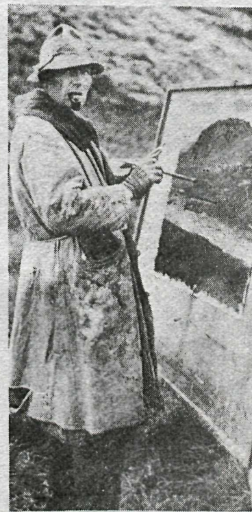
■ Jóhannes Kjarval málaði sínar myndir oft úti í náttúrunni. Hann málaði um allt land. Hér er mynd af listamanninum við útvinnu.

Kjarval gaf Reykjavíkurborg á sínum tíma margar myndir, eða árið 1968, og einhvern veginn læðist sá grunur að manni, að þær hafi aldrei allar verið sýndar. Ef svo er, þyrfti endilega að koma þeim hið fyrsta á framfæri, til