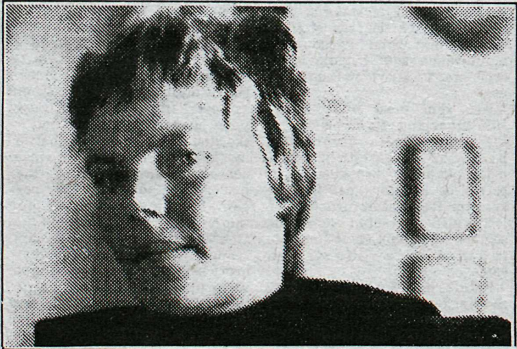
Í nýrri bók sinni lýsir Márta Tikkanen geðveiki sonar síns.