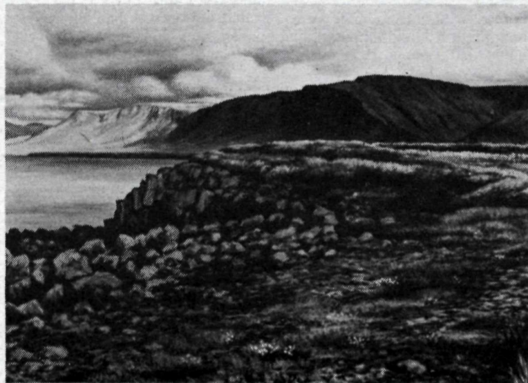
Úr Laugarnesi í Reykjavík — Esja í baksýn.