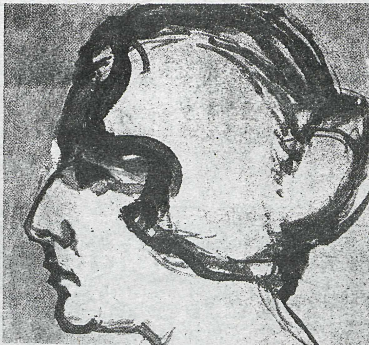
■ KONA vatnslitamynd eftir Kjarval, ein myndanna í bókinni.

Hafði þær fyrst fyrir barnsaugum austur í Meðallandi er þær mogguðu undir færum, en til