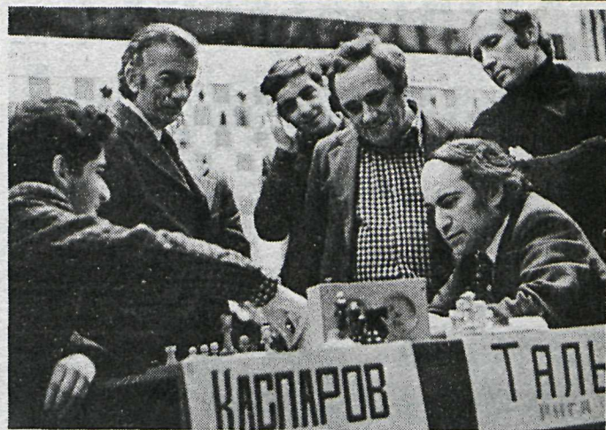
■ Tal að tafli við Kasparov.