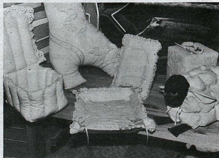
Þessir hlutir eru tilsníðir í pökkum og kostar hver pakki um 120 krónur.

búna efni sem þarf í eitt teppi. Kostar efni í eitt teppi frá 500 krónum allt upp í 900 krónur ef um tvíbreitt rúmteppi er að ræða. Efnisstrangarnir eru 115