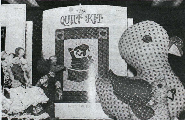
5 mýs í kassa kosta 375 krónur og þrjú ungar í pakka kosta um 90 krónur. Lítil stykki sem á eftir að sauma saman kosta frá 38 krónum.