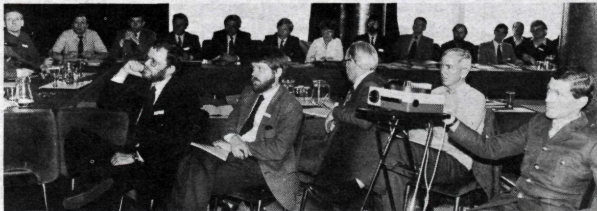
Séð yfir ráðstefnusalinn í Hótel Sögu.