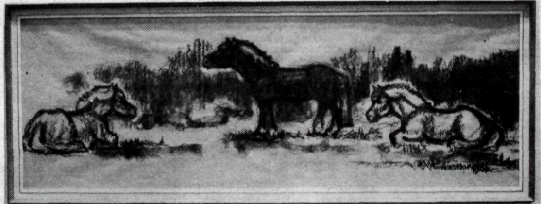
„Hestar“ (teikning), mynd nr. 66.