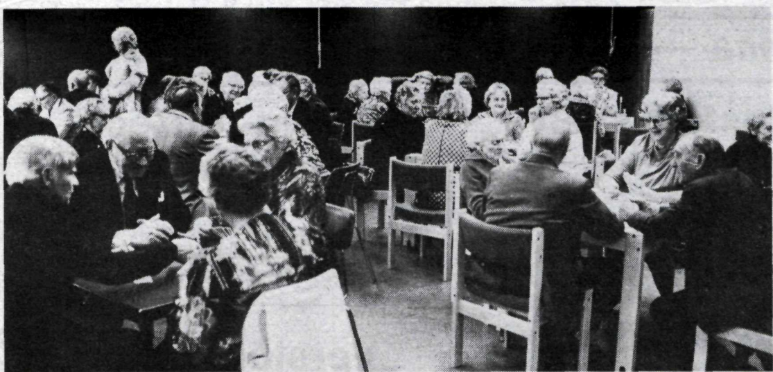
Félagsvistin er mjög vinsæl hjá eldri borgurum í Reykjavík.