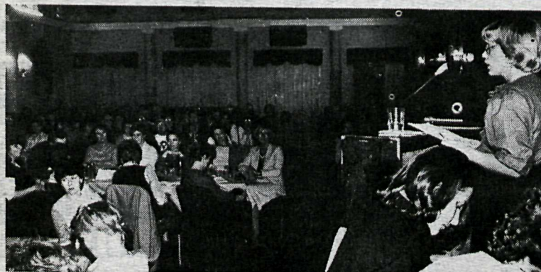
■ „Kvenframbjóðendurnir voru málefnalegir og lausir við hið persónulega skitkast sem oft vill einkenna pólitískar umræður.“