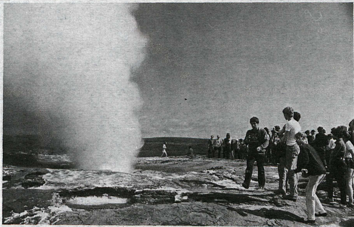
Frá generalprufunni s.l. sunnudag. Ljós. SBI.

Galleri Langbrók er opið milli kl. 14 og 16 bæði laugardag og sunnudag.