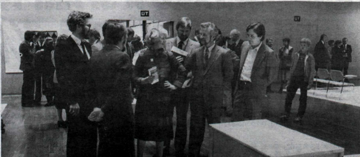
Forseti Íslands, Vigdís Finnbogadóttir, skoðaði sýninguna sl. mánudag, ásamt Hjörleifi Guttormssyni og fleiri gestum, og var myndin tekin við það tækifæri.

er, að sögn forráðamanna Kjarvalsstaða, að leiða saman listamenn og framleiðendur til sameiginlegs átaks og vekja með því móti athygli á því hvernig listin getur unnið fyrir og með hinum ýmsu þáttum atvinnulífsins. Í því sambandi er á það bent hvernig þróun hönnunar t.d. í Finnlandi og Danmörku hefur sannað hverju hugvit og listrænn metnaður fá áorkað í þessum efnun.