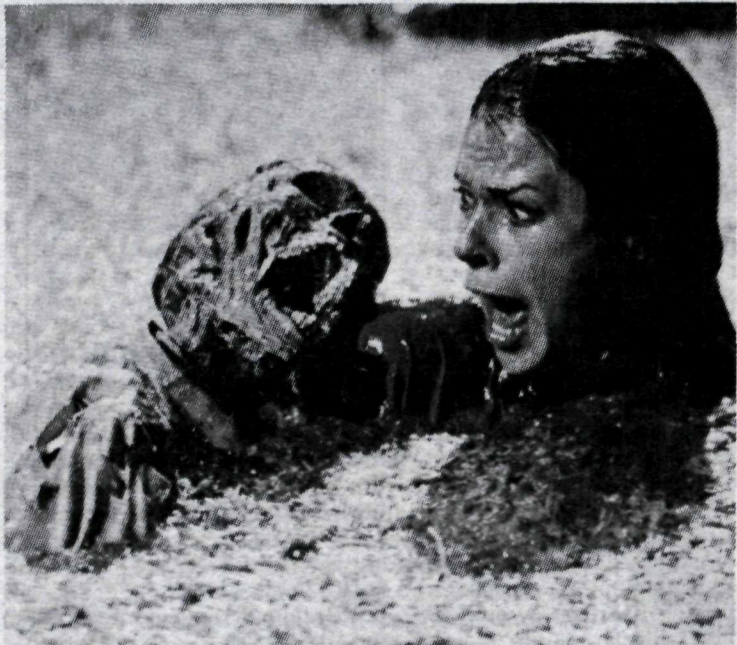
Jobeth Williams, í hlutverki móðurinnar, í óskemmtilegum félagsskap í lokauppgjöri manna og illra afla í POLTERGEIST .

En húsráðendur una ekki hag sínum lengur á þessum stað, að auki hafa þau komist að því að það er byggt á gömlum kirkjugarði og þar virðist komin skýringin á djöfulganginum. Húsbóndinn heldur á braut til að ganga frá sínum málum fyrir