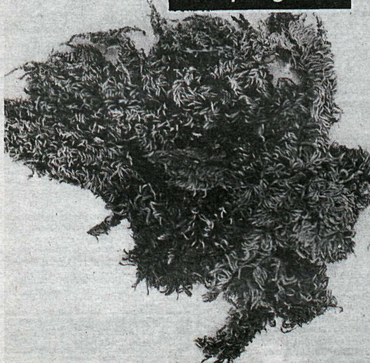
Jurtasýningin í Norræna húslu er harla fróðleg. Hér að ofan sést mosinn homalothecium sericeum .

Sýning Norræna hússins á íslenskum jurtum á án efa eftir að koma mörgum á óvart. Á sýningunni gefur að líta fjöldann allan af mosum en auk þess má á sýningunni sjá þörungur, fléttur, lyng og fleiri plöntur. Gróðurinn á sýningunni er þannig vaxinn að fæstir veita honum að jafnaði athygli né hafa tækifæri til að virða hann fyrir sér.