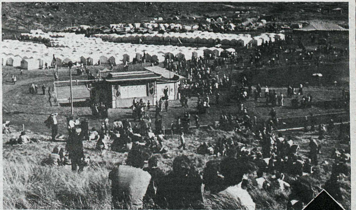
Það er notalegt að sitja í brekkunni í Herjólfsdal og fylgjast með því sem fram fer á þjóðhátíð. Og alltaf setja hvít tjöld heimamanna mikinn svip á hátíðina.