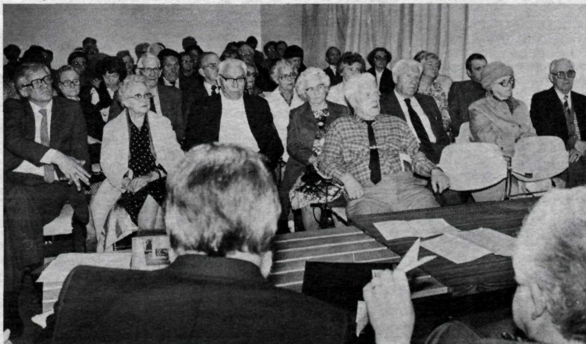
Fundarsalur Kjarvalsstaða var þéttskipaður og fundarmenn hátt á annað hundrad.

Ráðherra taldi baráttuna hafa einkennzt af vörn, sem hann teldi að snúa bæri í sóknarátt. Sýningin væri merkilegt framlag í þá átt, að sýna fram á, að þáttur aldraðra hefði verið vanmetinn. Hann þakkaði aðstandendum sýningarinnar og sleit henni.