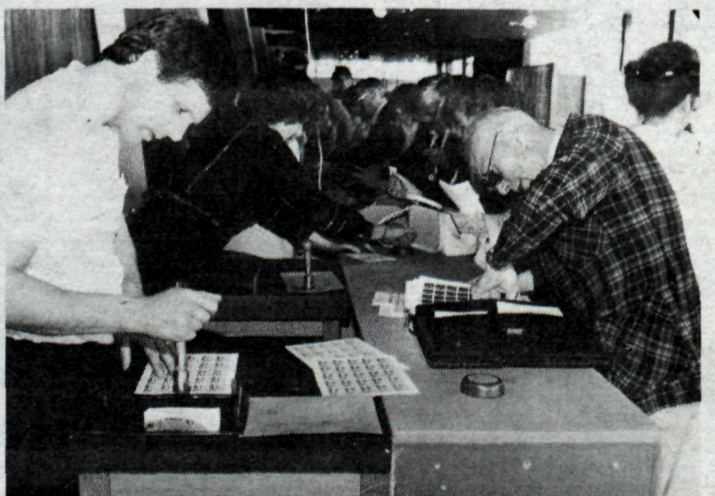
Mikið var að gera á pósthúsinu á Kjarvalsstöðum, sem er í tengslum við FRÍMEX 1982.