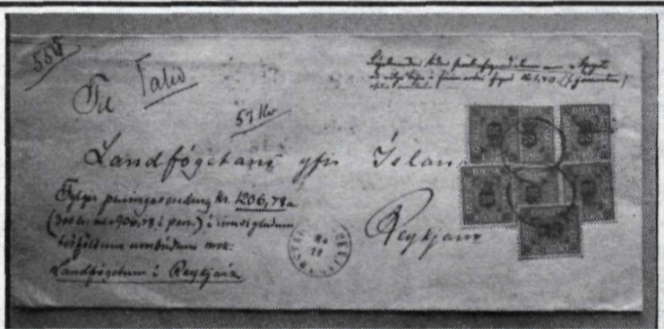
Myndin er af gömlu umslagi sem fannst fyrir skömmu í Þjóðskjalasafni. Er það stílað á landfógetann á Íslandi.