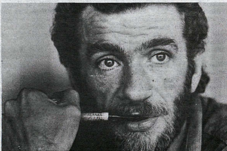
„Listamenn eru síðustu stéttleysingjar á Íslandi.”

„Ég er Reykvikingur, en ættaður úr Þingvallasveitinni og sunnan með sjó. Ég fór í Iðnskólann og lærði trésmíði og vann sem slíkur í mörg ár. Þegar ég stóð á þrítugu eða rúmlega það stóð ég á tímamótum. Ég var á þessum tíma giftur og nokkurra