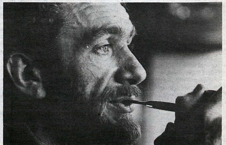
„Ég er ekkert hræddur við að verða fyrir áhrifum.”