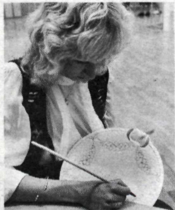
Danskur postulínsmálari er á sýningunni og mun skreyta diska samkvæmt aldagamalli hefð.

Nýjung er hjá Bing & Gröndahl á sýningunni. Eins og jólaplatti varð grundvöllur að safnarahefð allt frá árinu 1895, þá er nú á þessu ári byrjað á annarri safnarahefð, „ársstyttni“. Er það stúlka með bolta, sem er fyrsta styttni í þessum flokki og mun styttni kosta um 985 kr. Þegar hún kemur í verðlaunir í byrjun september.