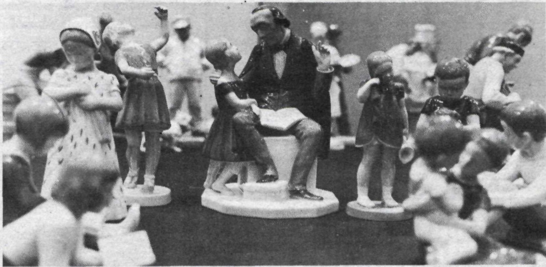
Þarna er H.C. Andersen að segja lítilli vænu sögu. En hvaða sögu, það er erfitt að segja. Sagan hlýtur að vera skemmtileg, því sú litla hlustar hugfangin á.

Þá er á sýningunni safn sjaldgæfra platta, þar á meðal