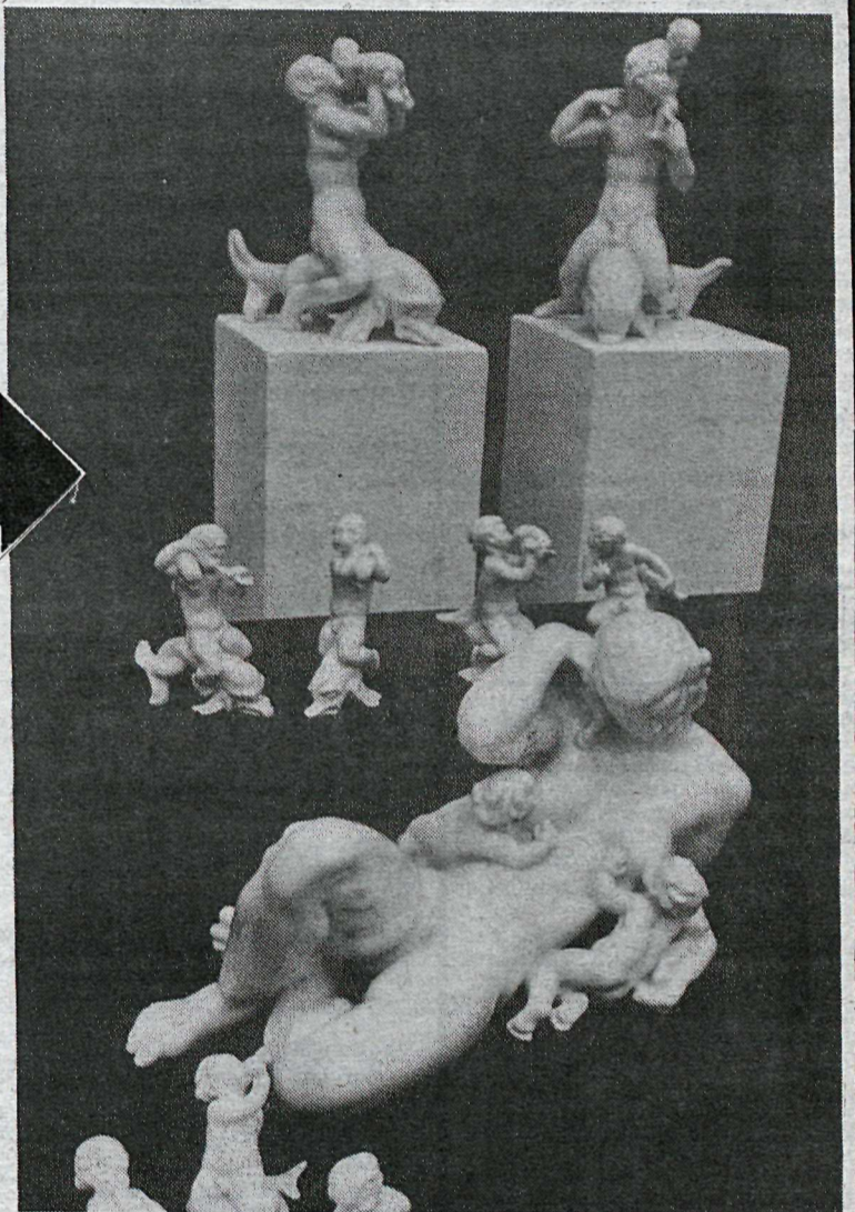
Fjölbreytnin í listmunum frá Bing & Grøndahl er mikil. Hér sést sýnishorn af hvítum stytum sem sýndar eru á Kjarvalsstöðum.