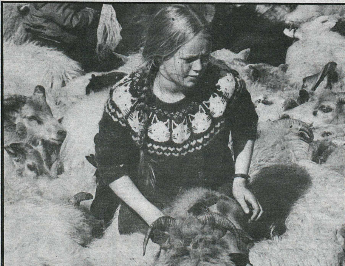
Nú eru göngur og réttir í þann veginn að hefjast, í sumum sveitum viku fyrir en venjan hefur verið. Á sunnudaginn voru „forréttir“ í Auðkúlurétt og þar var meðfylgjandi mynd tekin.