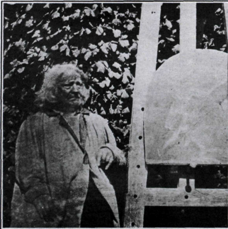
Fyrsta ljósmyndin sem tekin var í Danmörku og hin eina sem til er af Thorvaldsen.