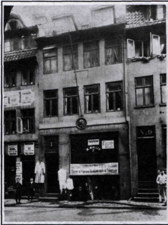
Fæðingarstaður Thorvaldsens við Grænugötu 7 í Kaupmannahöfn. Hann fæddist í bakhúsi lóðarinnar nr. 7.