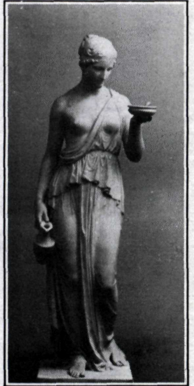
Höggmyndin af Hebu, unnin í marmara.