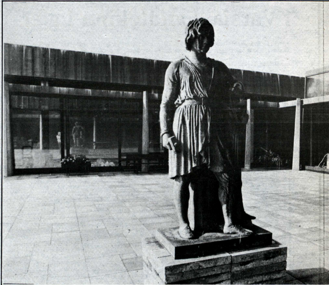
Sjálfsmynd Thorvaldsens fyrir framan Kjarvalsstaði, þar sem sýning á verkum hans mun standa í tvo mánuði.

Kommúnistar tala gjarnan um sjálfa sig sem málsvara sósíalisma, verkalýðshreyfingar og þjóðfrelsis. Komnir í valdastóla kasta þeir grímuni. Það er verkalýðshreyfingin og þjóðfrelsið sem eru undir flokkshælum í Póllandi. Það eru herlög en ekki þegnréttindi sem einkenna þjóðfélagið, skortur á nauðsynjum og fótum troðin mannréttindi.