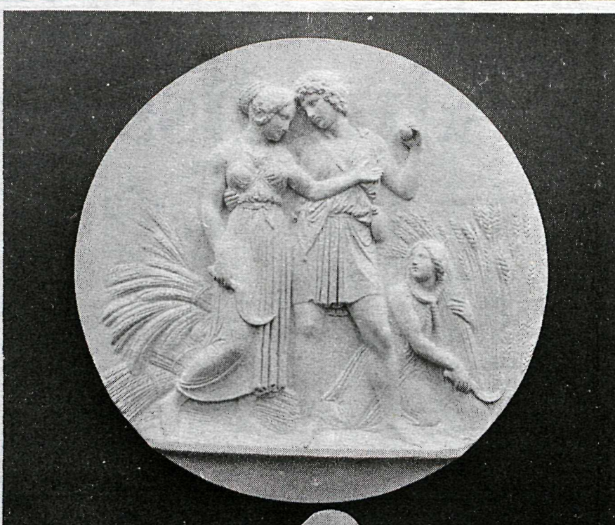
Æska og sumar, eitt verkanna á sýningunni