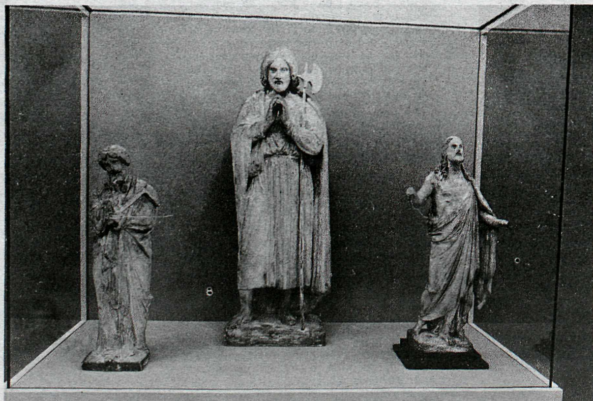
Tómas t.v., þá Júdas og síðan Kristur.