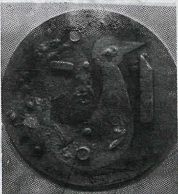
Fuglinn í fjörunni, 1981-82.

urinn hefur oft þrætt einstigið milli þessara veggja myndmála. Abstraktmyndirnar hér á sýningunni bera þó fyrst og fremst vott um ákveðna leit og efnisrannsóknir hjá listamanninum. Vart getum við talað hér um neinar athyglisverðar niðurstöður; þó er vist að „slettimyndirnar“ gefa til kynna ákveðna möguleika (sérstaklega hvað varðar efni tré og sement?) sem gaman væri að sjá í stærri hlutföllum og ítarlegri úrvinnslu.