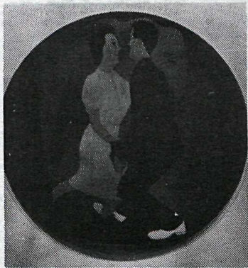
Ástríðudansinn (Tango Jalousie), 1981-82.

Listamaðurinn sýnir nú 88 ný myndverk að Kjarvalsstöðum. Það fyrsta sem maður tekur eftir hér á sýningunni er hve hún er sundurslitin og verkin innbyrðis ólík. En með nokkurri einföldun getum við þó sagt að sýningin skiptist í tvennt: abstraction og figúratífar myndir. Það er þó ekki að undra því listamað-