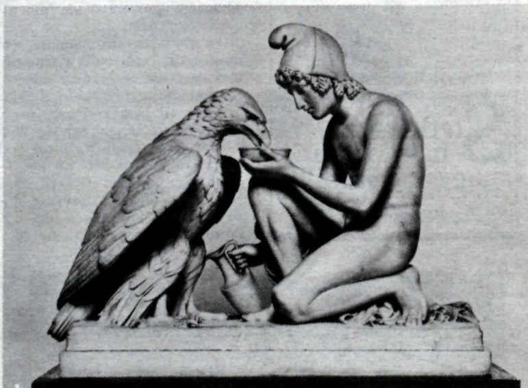
Ganymede með örn Jupiters

rekja til Skagfirðinga. Faðirinn fluttist ungur til Danmerkur, en Bertel var þar fæddur og upp- inn og leit aldrei land síns föður. Eins og einn ágætur vinur minn sagði í gamni, Flugleiðir voru ekki komnar í gagnið í þann tíð. Mestan hluta ævi sinnar dvaldi Thorvaldsen í Rómaborg og haslaði sér þar svo rækilega völl, að á stundum hefur hann verið flokkaður undir rómverska hefð í höggmyndalist. Væri ef til vill enn markvissara að telja hann til Grikkja, hvað þetta snertir, svo hugleikin var fornöldin hon- um og hvarvetna má lesa úr verkum hans áhrif frá hinum fornu Grikkjum. Og fullvíst er, að engir listamenn á vesturlönd- um hafa verið jafn rótgrónir fornum tímum í höggmyndagerð og þessi undramaður, sem svo eftirminnilega sigraði samtíð sína með verkum sínum, að vart verður hliðstæða fundin. Vera Thorvaldsen og frægd hans í Róm á sér enga hliðstæðu, og á sínum tíma var frægd hans svo mögnuð, að furstar og aðallinn lögðu rauðan dregil í veg fyrir hann, hvert sem hann fór. Jafn-